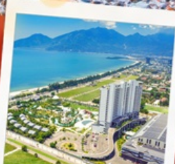
Mikazuki Japanese Resorts & Spa