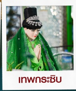
เทพกระซิบ