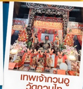
เทพเจ้ากวนอู วัดกวนไท่