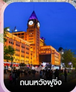
ถนนหวิงฟู่จิ่ง

✈️ คอนเฟิร์มออกเดินทาง ทุกพีเรียด 2 ท่านขึ้นไป