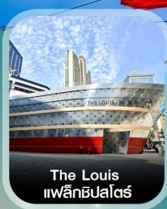
The Louis แม็ลลิสปาส์