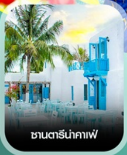
ซานโตรินาคาเฟ่

คอนเฟิร์มออกเดินทาง ทุกพีเรียด 2 ท่านขึ้นไป