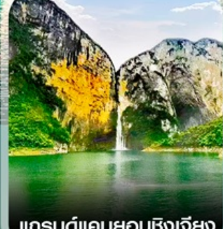
แกรนด์แคนยอนซิงเจียง