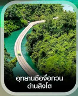
อุทยานซีจื่อกวน ด่านสิงโต