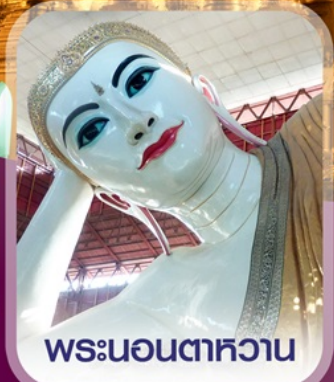
พระนอนตาทหาว