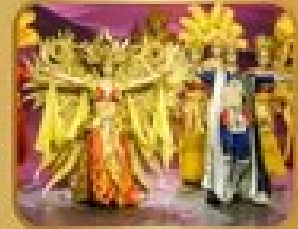
ชมการแสดงละครจีน THE GOLDEN MASK DYNASTY