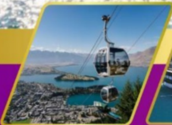
นั่งกระเช้า gondola รับประทานอาหาร บนยอดเขาบ็อบพ็อค