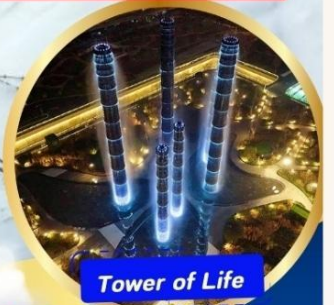
Tower of Life