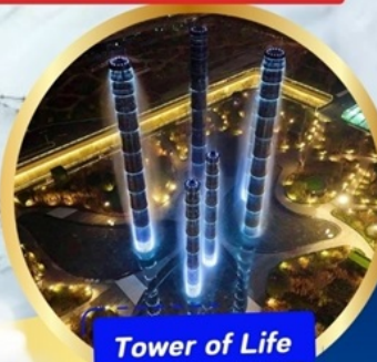
Tower of Life