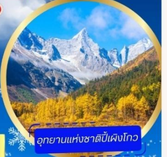
อุทยานแห่งชาติปี้เผิงโกว

อุทยานภูเขาสี่ดรุณี หุบเขาของเสี่ยวโกว (รวมรถอุทยาน) อุทยานปี้เผิงโกว (รวมรถอุทยาน + รถแบตเตอรี่) ภูเขาหิมะการ์เซียต้ากู่ปิงชว่น (รวมรถอุทยาน + กระเช้า) - วัดต้าฉือ ดินแดนเดินชุนซีลู่ - ชมแสงสี The Tower of Life ที่ลานห้าง SKP ถนนคนเดินชอยกวางแจม - POP MART