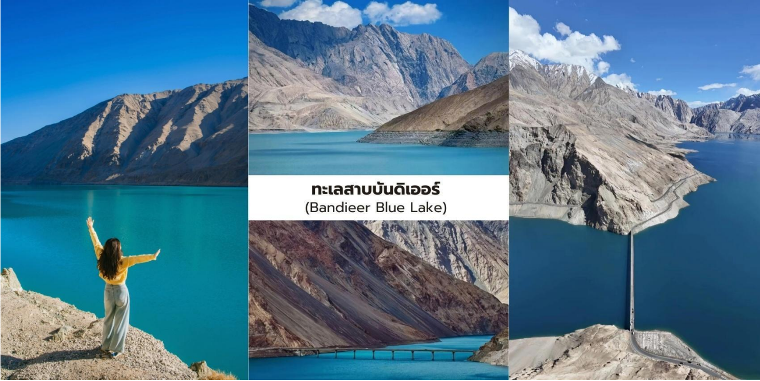
ทะเลสาบบันดิเออร์ (Bandieer Blue Lake)

จากนั้นนำท่านเปลี่ยนการเดินทางในช่วงนี้โดยใช้ รถยนต์ 7 ที่นั่ง ตามที่กำหนด เพื่อให้สามารถลดเลาะไปตามเส้นทางภูเขาที่คดเคี้ยวได้อย่างสะดวกและปลอดภัย นับเป็นอีกหนึ่งประสบการณ์การเดินทางบนถนน ภูเขาที่มีเอกลักษณ์ที่สุดแห่งหนึ่งของเส้นทางท่องเที่ยวในซินเจียง