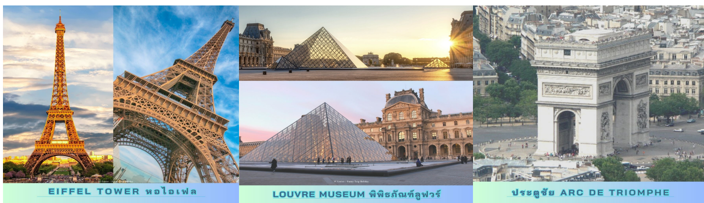
EIFFEL TOWER หอไอเฟล

นำท่าน ชมหอไอเฟล (EIFFEL TOWER) ซึ่งเป็นสัญลักษณ์ของกรุงปารีส เลิศหรู อลังการ โรแมนติก มหัศจรรย์ ด้วยความสูง 984 ฟุต สร้างด้วยโครงเหล็กทั้งหมด...ถนนชองเซลีเซ (CHAMPS-ELYSEES) ถนนที่มีต้นไม้เรียงรายทั้งสองข้างทางอย่างน่าเดินเล่น ต้นแบบถนนราชดำเนิน ปลีซเดอลา ค็องคอร์ด (PLACE DE LA CONCORDE) จตุรัสแห่งความสามัคคี โบสถ์แมดดีแลน ที่สร้างแบบกรีกโบราณ ถ่ายรูปกับปิระมิดหน้าพิพิธภัณฑ์ลูฟวร์ หรืออดีตพระราชวังลูฟวร์ จากนั้นนำท่าน ชมเมืองปารีส มหาราชินีแห่งเมืองหลวงของโลก ..ถ่ายรูปคู่กับประตูชัย (ARC DE TRIOMPHE) ของพระเจ้านโปเลียนอาร์ค เดอทร็อม ให้ท่านช้อปปิ้งสินค้าแบรนด์เนมที่มีชื่อเสียง ณ ห้างแกลอรีลาฟาแยส เช่น หลุยส์,