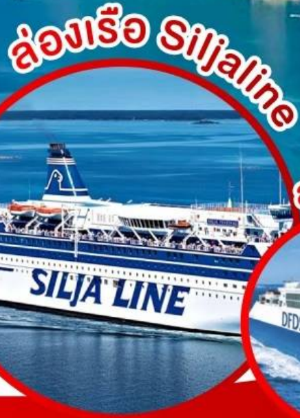
ล่องเรือ Siljaline

พิเศษ!! 8 ล่องเรือและพักบนเรือสำราญ SILJALINE 8 ล่องเรือและพักบนเรือสำราญ DFDS SEAWAY 8 ล่องเรือชอนน์เฟอร์ด์ 8 รถไฟสายโรเมนติค ฟลัมบาน่า 8 บินภายในไม่ต้องนั่งรถไกล