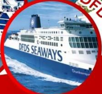
ล่องเรือ DFDS