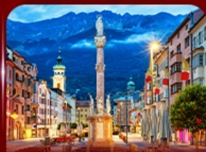
เที่ยวย่านเมืองเก่า อินส์บรุค