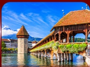
สะพานไม้ชาเปล ลูซิริน