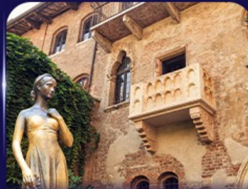
เยือนบ้านจูเลียต เวโรนา