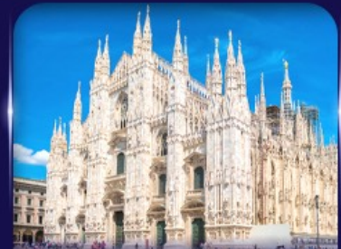
เข็ควินวิหารดูโอโม มิลาน