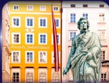
บ้านเกิดโมซาร์ท ซาลซ์บูร์ก