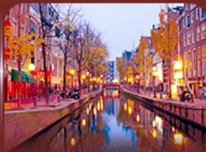
ย่าน Red Light อันสเตอร์ดัม