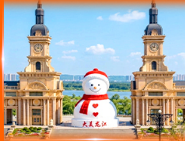
ตึกตาสหิมะยักษ์ ฮาร์บิน