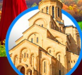
โบสถ์กรินดี เมืองทบิลีซี