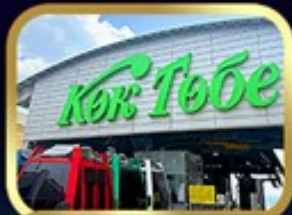
ซินโกกโทเบมวิอัลมาตี

นั่งกระเช้าชิมบุลัก • ทะเลสาบโคลโซ • ชารินเกรนด์แคนอน