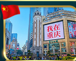
ถนนคนเดินเจียงฟางเป่ย์