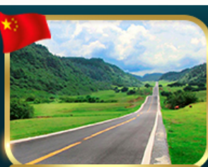
ชมวิวยุทยานเขานางฟ้า