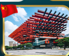
แลนด์มาร์กจั๊ว ตึกตะเกียบ