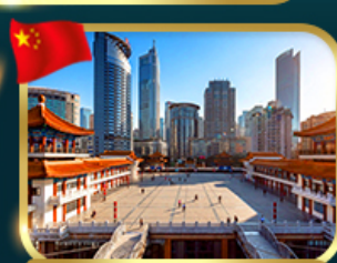
เข็คอินตึกไคว่ซังโหล