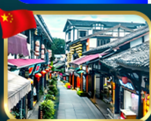
หมู่บ้านโบราณฉือซื่อ

เที่ยวอุทยานหลุมพี้สะพานสวรรค์ + เขานางฟ้า