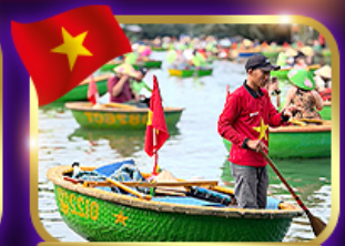
เรือกระด้ง หมู่บ้านกัมทาน