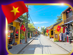
เมืองท่ามรดกโลก ฮอยอัน