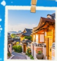
หมู่บ้านนุกซอน