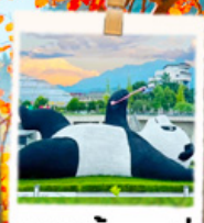
แพนด้าชิลฟี