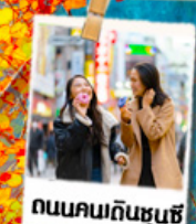
ถนนคนเดินชุนช