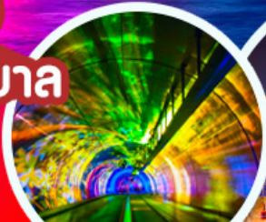
จูโมงด์เลเซอร์