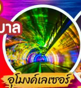
อุโมงค์เลเซอร์