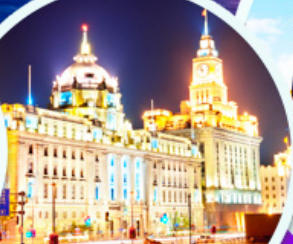
เดอะบันด์