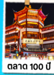
ตลาด 100 ปี