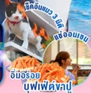
อิมอร้อย บุปเฟ่ต์จปู

ไฮไลท์!! สัมผัสความงามของดอกซากุระก่อนใคร ณ เมืองคาวาซึ ชมงานประดับไฟที่หมู่บ้านเยอรมัน 1 ใน 10 งานประดับไฟที่สวยงามที่สุดในญี่ปุ่น ขึ้นภูเขาไฟฟูจิชั้น 5 หรือ เล่นสกี ณ ฟูจิเท็นสกีรีสอร์ท (ขึ้นอยู่กับสภาพอากาศ) สักการะสิ่งศักดิ์สิทธิ์ ณ วัดอาซากุสะ พร้อมเดินชม ของอร่อยๆ ที่ ถนนนากามิเสะ