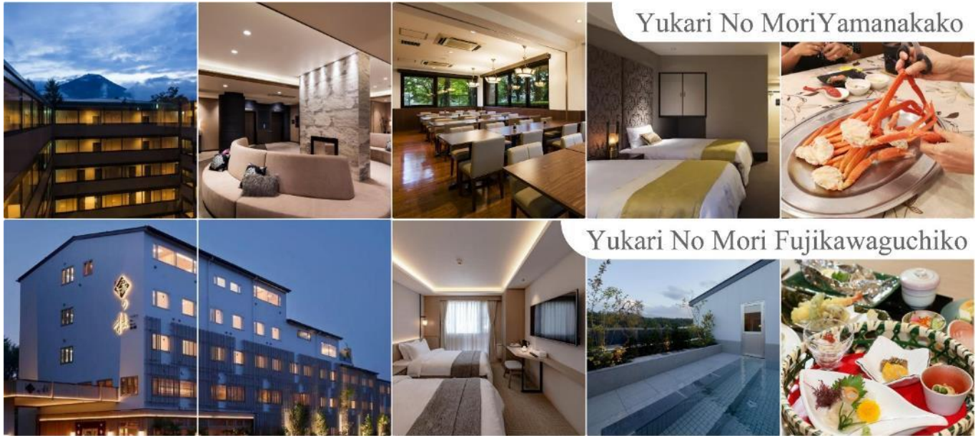
Yukari No Mori Yamanakako