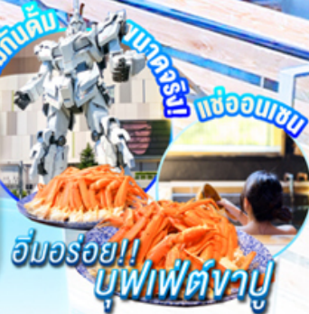
ฮิมมอรอย!! บัพพิตงาบู