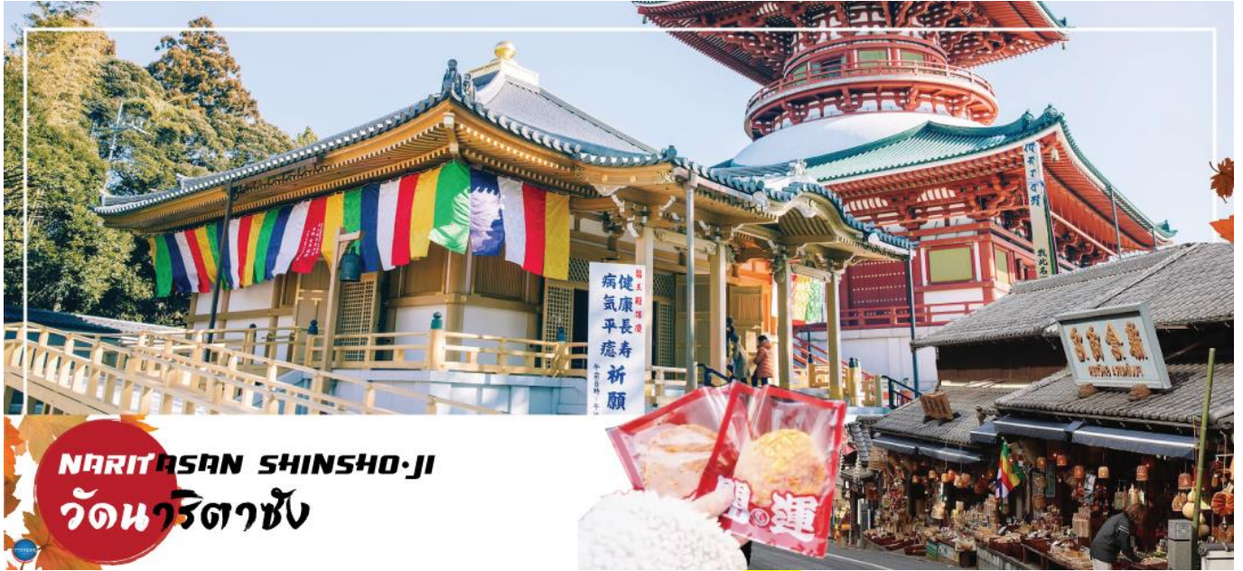
NARITASAN SHINSHO-JI วัดนาริตะชิน

วันที่หก เมืองนาริตะ – วัดนาริตะชิน – ถนนโอมโตะซังโตะ – อีออน มอลล์ – ท่าอากาศยานนานาชาตินาริตะ – ท่าอากาศยานสุวรรณภูมิ