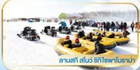
ลานสกี สโนว์ ฮักโซฟาโนราม่า