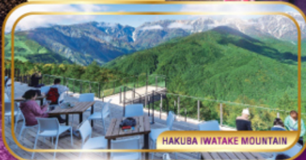
HAKUBA IWATAKE MOUNTAIN