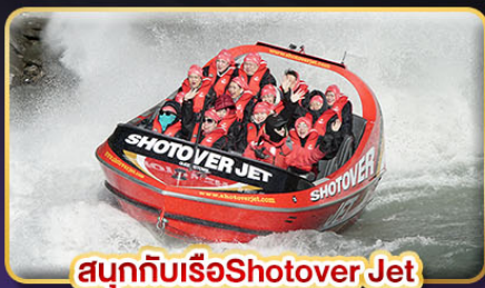
สนุกกับเรือ Shotover Jet