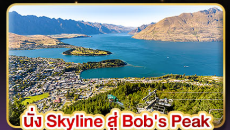
นั่ง Skyline สู่ Bob's Peak