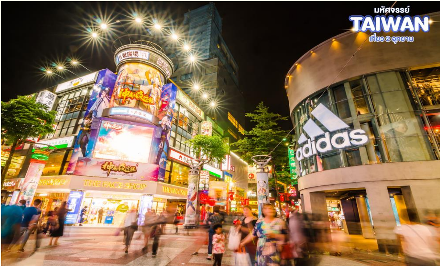
มหัศจรรย์ TAIWAN เที่ยว 2 อุทยาน