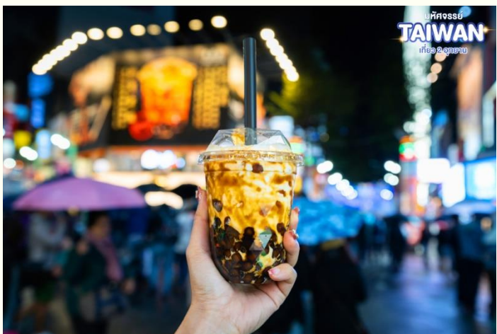
มหัศจรรย์ TAIWAN เที่ยว 2 อุทยาน