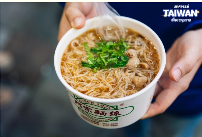
มหัศจรรย์ TAIWAN เที่ยว 2 อุทยาน