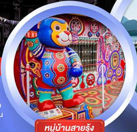
หมู่บ้านสายรุ้ง