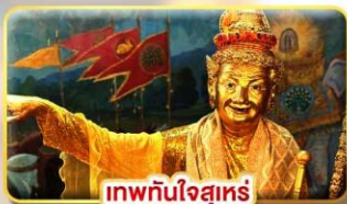
เทพทันใจสุเหร่