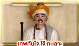
เทพทันใจ ใจ กะเลาะ