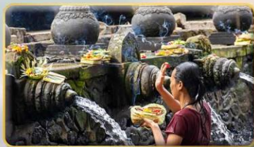
วัดน้ำพุศักดิ์สิทธิ์