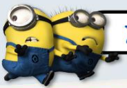
ZONE 5 : THE LOST WORLD