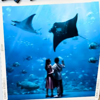
ZONE 7 : FAR FAR AWAY