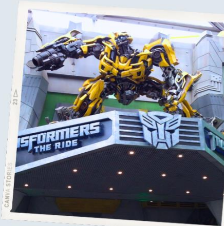
ZONE 1 : HOLLYWOOD