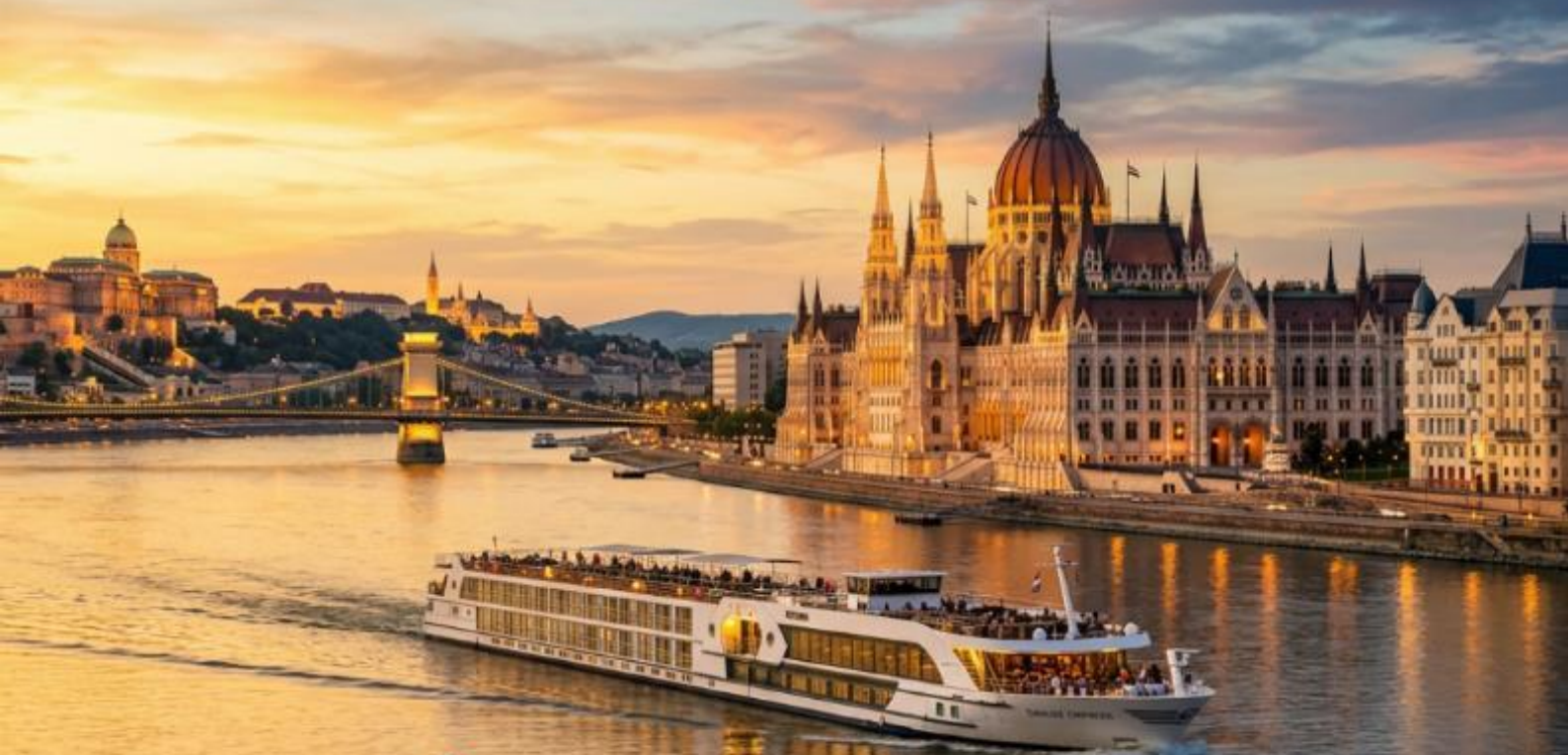
อัลสตัดท์วิวสวยสุดใจ