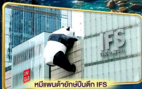
หมีแพนด้ายักษ์ปีนตึก IFS