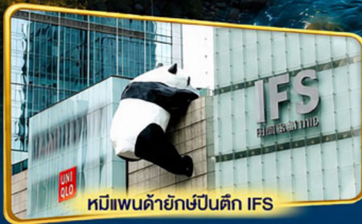
หมีแพนด้ายักษ์ป็นตึก IFS