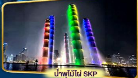
น้ำพุไม้ไผ่ SKP