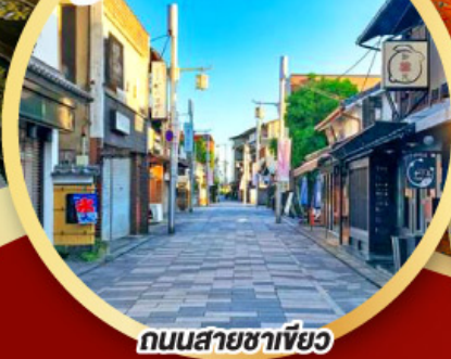
ถนนสายชาเขียว