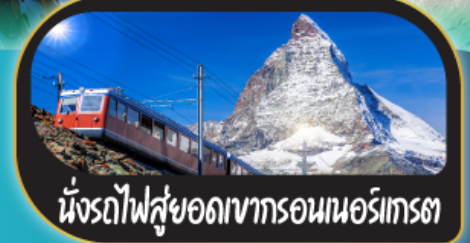
นั่งรถไฟสุดเขากรอนนอร์เกรต