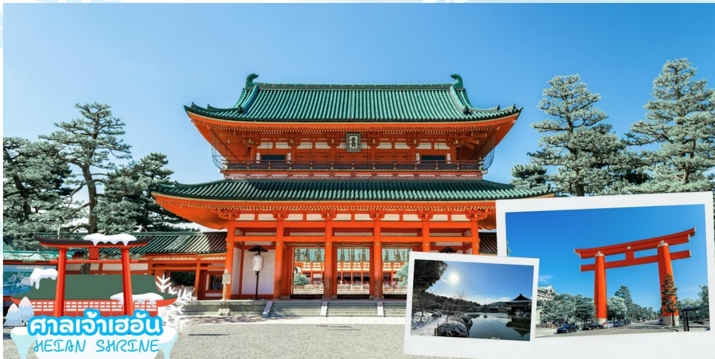
ศาลเจ้าเฮอัน HEIAN SHRINE

ศาลเจ้าเฮอัน (Heian Shrine) สร้างขึ้นเพื่อเป็นอนุสรณ์ฉลองอำนาจปกครองของเมืองเกียวโตที่ครบรอบ 1,100 ปีในฐานะเมืองหลวงของประเทศญี่ปุ่น โดยมีประตูโทริอิสีแดงตระหง่านเป็นองค์ประกอบที่สะดุดตาที่สุด ศาลเจ้าแห่งนี้เป็นสัญลักษณ์อันโดดเด่นและสถานที่ท่องเที่ยวสำคัญของเกียวโต บริเวณด้านหลังของศาลเจ้านี้ มีสวนเฮอัน ครอบคลุมพื้นที่ประมาณ 33,000 ตารางเมตร สามารถเดินเล่นสัมผัสความร่มรื่นได้อย่างสงบผ่อนคลาย บรรยากาศธรรมชาติของที่นี่เรียกได้ว่าสวยงามทุกฤดูกาล