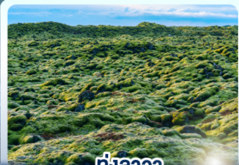
ทุ่งลาวา