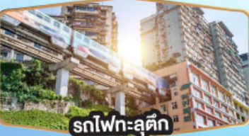
รถไฟฟ้าสุดคึก