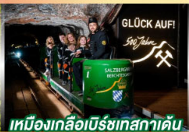
เหมืองเกลือเบิร์ชเทสกาเดิน