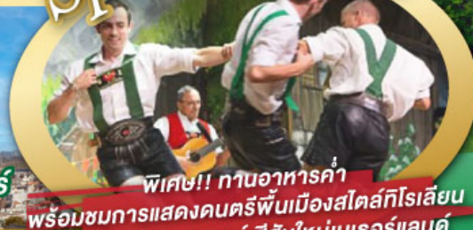
พิเศษ!! ทานอาหารค่ำ พร้อมชมการแสดงดนตรีพื้นเมืองสไตส์ทีโรเลียน และเยือนเมืองอูเทรคต์ สีสันใหม่เนเธอร์แลนด์

ไฮไลท์ในโปรแกรม • เยือนเมืองแห่งแคว้นบาวาเรีย และ ทีโรล • สุกสนานเหมืองเกลือเบิร์ชเทสกาเดิน • เข้าชมปราสาทนอยชวานสไตน์ • เดินเล่นจัตุรัสโรเมอร์ ซอปปิง Zeil Street • ถ่ายรูปมุมสวยของหมู่บ้านอัลสติก • ซิลลา ไปในเมืองซาลสบูร์ก บ้านเกิดโมสาร์ท • ล่องเรือหมู่บ้านทีธูร์น และ ล่องเรือชมนครอัมสเตอร์ดัม • ซอปปิงจุใจย่านดัมสแควร์และเดินเล่นย่านโคมแดง