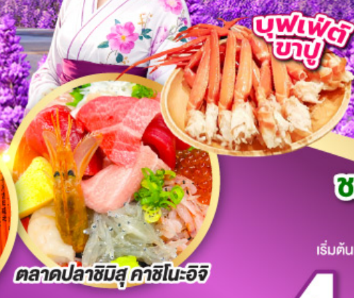
ตลาดปลาฮิมิสึ คาชิโนะอิชิ