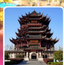
วัดหลงหยวน