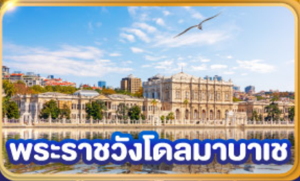
พระราชวังโดลมาบาซ