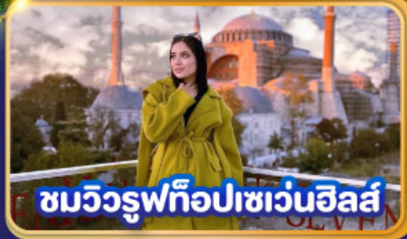
ชมวิวยูฟิโอปเซเวนฮิลส์