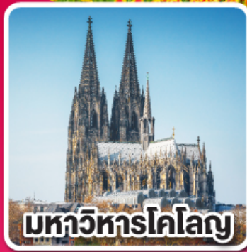
มหาวิหารโคโลญ