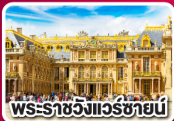
พระราชวังแวร์ซายน์