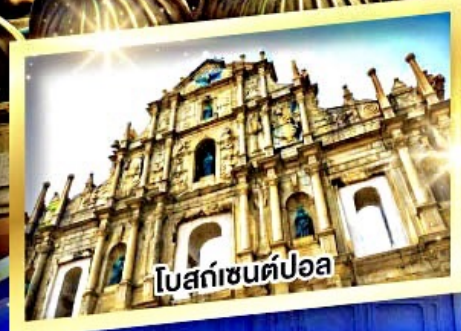
โบสถ์เซนต์ปอล

แบบพิเศษ ห่านย่าง, ต้มข้าวฮ่องกง, บุฟเฟ่ต์สไตล์ฮ่องกง